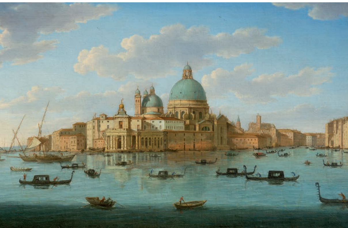
HENDRIK FRANS VAN LINT ( Anversa 1684 - Roma 1763 ) Veduta della chiesa della Salute con la Punta della Dogana, 1750 ca Olio su tela, 46,5 x 71,5 cm Collezione Intesa Sanpaolo Gallerie d'Italia - Palazzo Leoni Montanari, Vicenza

La veduta di van Lint, raffigurante la chiesa della Salute con la Punta della Dogana a Venezia, fa parte della collezione di arte veneta del Settecento di Intesa Sanpaolo, esposta in modo permanente nelle Gallerie d'Italia - Palazzo Leoni Montanari, sede museale della Banca a Vicenza.